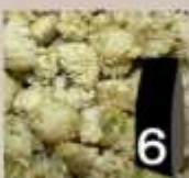
6 Camomilla romana