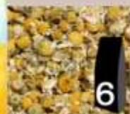
6 Camomilla fiori