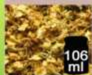
106 ml Gelsomino fiori