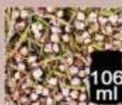
106 ml Erica fiori