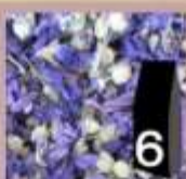
6 Malva fiori