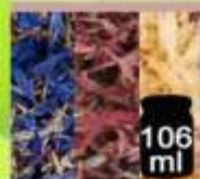
106 ml Fiordaliso petali blu, rossi o bianchi