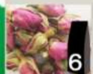
6 Rosa boccioli o petali