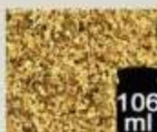
106 ml Sambuco fiori