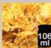
106 ml Calendula petali o fiori