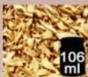
106 ml Fiancio dolce fiori